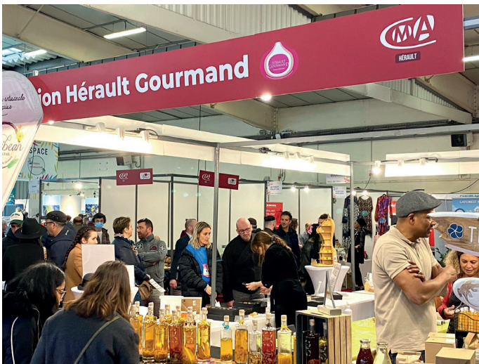
Dégustation Hérault Gourmand