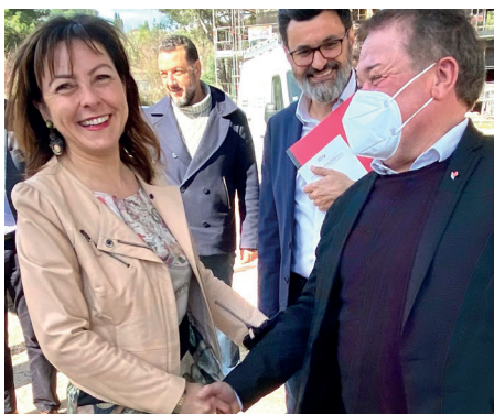
25 Mars 2022 - Rencontre avec Carole DELGA sur le chantier d'extension du lycée Frédérique Bazille-Agropolis à Montpellier