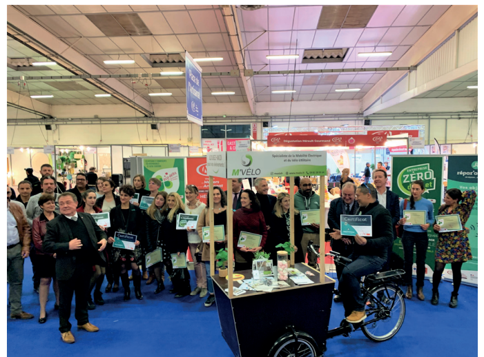
Remise de la 40 000ème entreprise artisanale de l'Hérault et des diplômes du développement durable