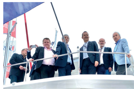
20 avril 2022 - Salon du multicoque à La-Grande-Motte