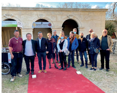
31 Mars 2022 - JEMA Journées Européenne des Métiers d'Art à l'Atelier Frédéric MATAN Tailleur de Pierre