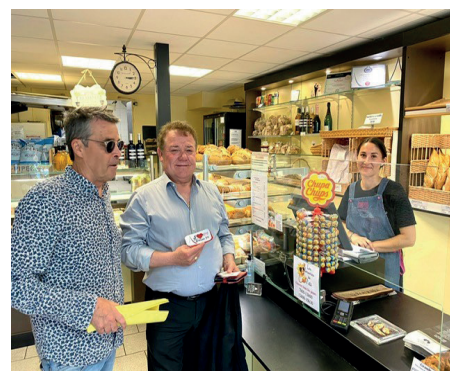
18 mai 2022 - Rencontre des artisans de Valras et Vendres