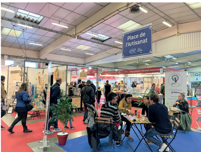
Place de l'Artisanat