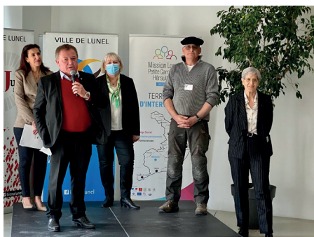
29 Mars 2022 - Journée de l'apprentissage à Lunel