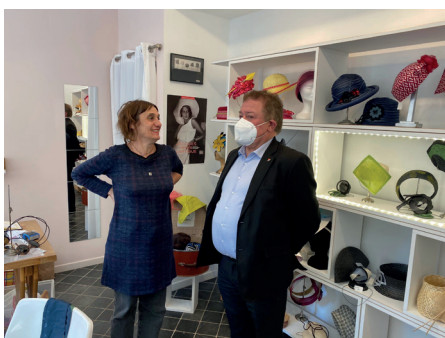
14 avril 2022 - Rencontre avec les artisans de Lodève