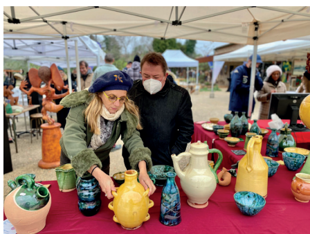
2 avril 2022 - JEMA à Saint-Jean-de-Fos